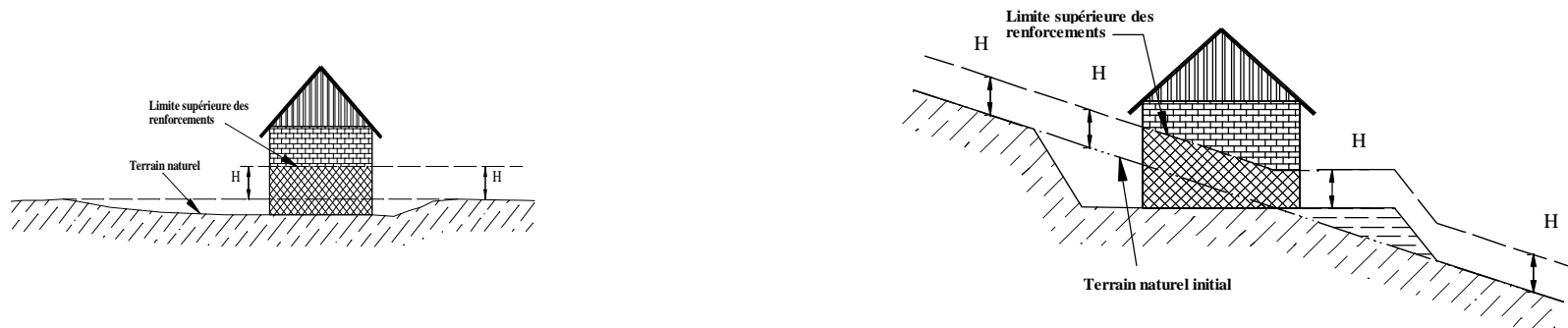
Figure 2: Détermination des hauteurs de référence par rapport au terrain naturel.

En cas de terrassement en déblais, la hauteur doit être mesurée par rapport au terrain naturel initial.