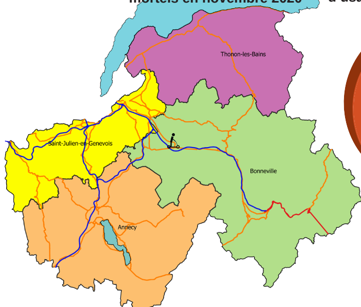
Localisation des accidents mortels en novembre 2020